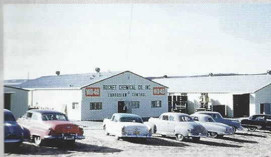
Daar staat 't, Rocket Chemical Co. WD-40 was oorspronkelijk bedoeld voor de ruimtevaart.